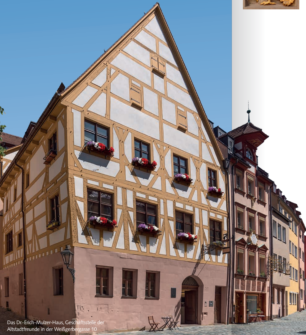
Das Dr.-Erich-Mulzer-Haus, Geschäftsstelle der Altstadtfreunde in der Weißgerbergasse 10